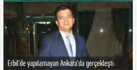
Erbil'de yapılamayan Ankara'da gerçekleşti