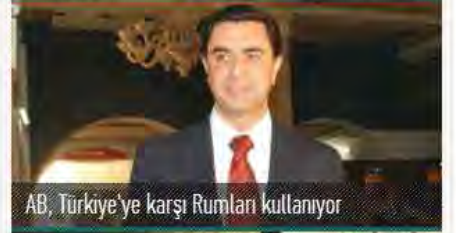
AB, Türkiye'ye karşı Rumları kullanıyor