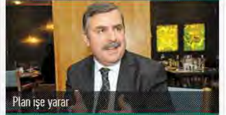
Plan işe yarar