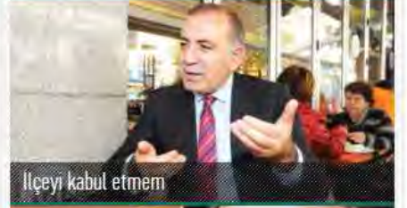
İlçeyi kabul etmem