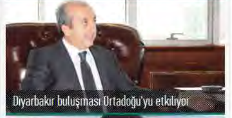
Diyarbakır buluşması Ortadoğu'yu etkiliyor