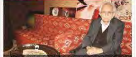
Bu hükümet yanlış yapmaz