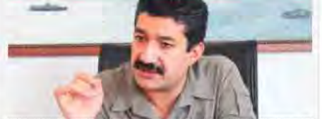
Çözüm süreci Kürtleri Türkiye'leştiriyor