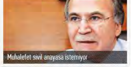
Muhalefet sivil anayasa istemiyor